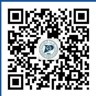
内蒙古工业大学 官方微信