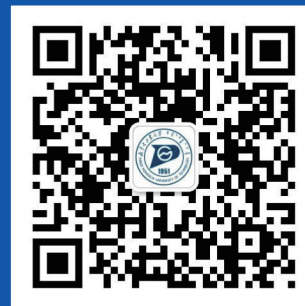
内蒙古工业大学 招生就业微信平台