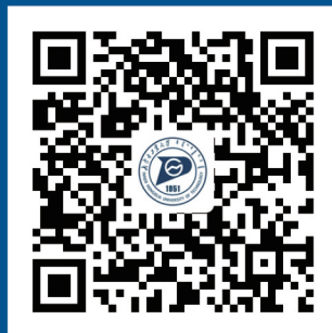
内蒙古工业大学 高招手机网站