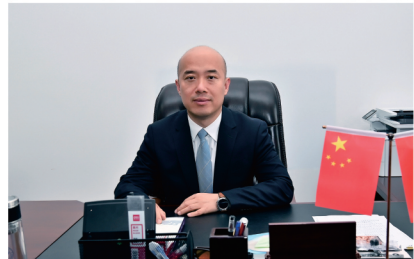
校党委副书记、校长：郭喜