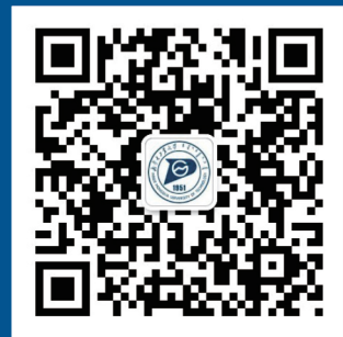
内蒙古工业大学 招生就业微信平台